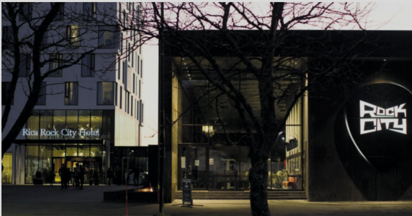
Kommunikasjonssvikt: Mastergradsstudenten har gått nærmere inn på hva som faktisk gikk galt med Rock City.